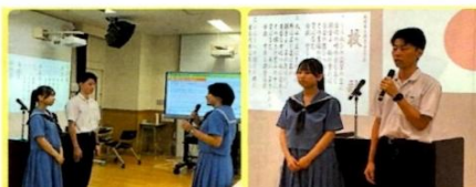
国民スポーツ大会（旧国体） 福岡県代表チームW選出！！