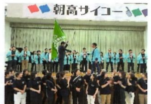
吹奏楽部 OB 会の演奏